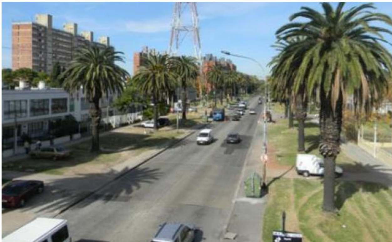
Por una calzada de 11 metros de ancho, el tránsito circula en ambos sentidos.