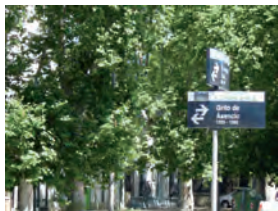
Semáforos Av. Suárez y Grito de Asencio