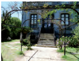
Scouts Atilio Pelossi