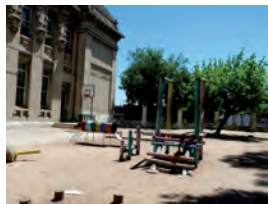
Un patio para mi Escuela; una Plaza para mi Barrio