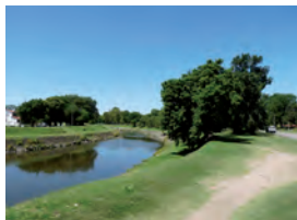
Recuperación espacio público en Rambla Costanera

Descripción: Obras de acondicionamiento del local del Grupo Scouts