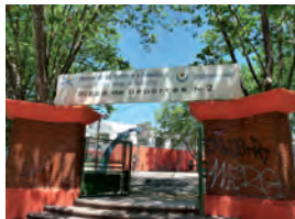
Acondicionamiento instalaciones Plaza N°2