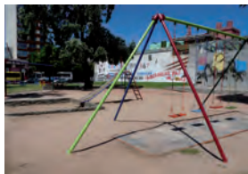
Juegos infantiles en Plazas de la zona